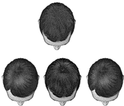
estilo libre coronilla derecha