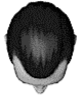
PELO HACIA ATRÁS