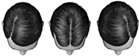
RAYA A DCHA RAYA AL MEDIO RAYA A IZQDA

Por la compra de dos sistemas tiene un 12% de descuento en los dos.